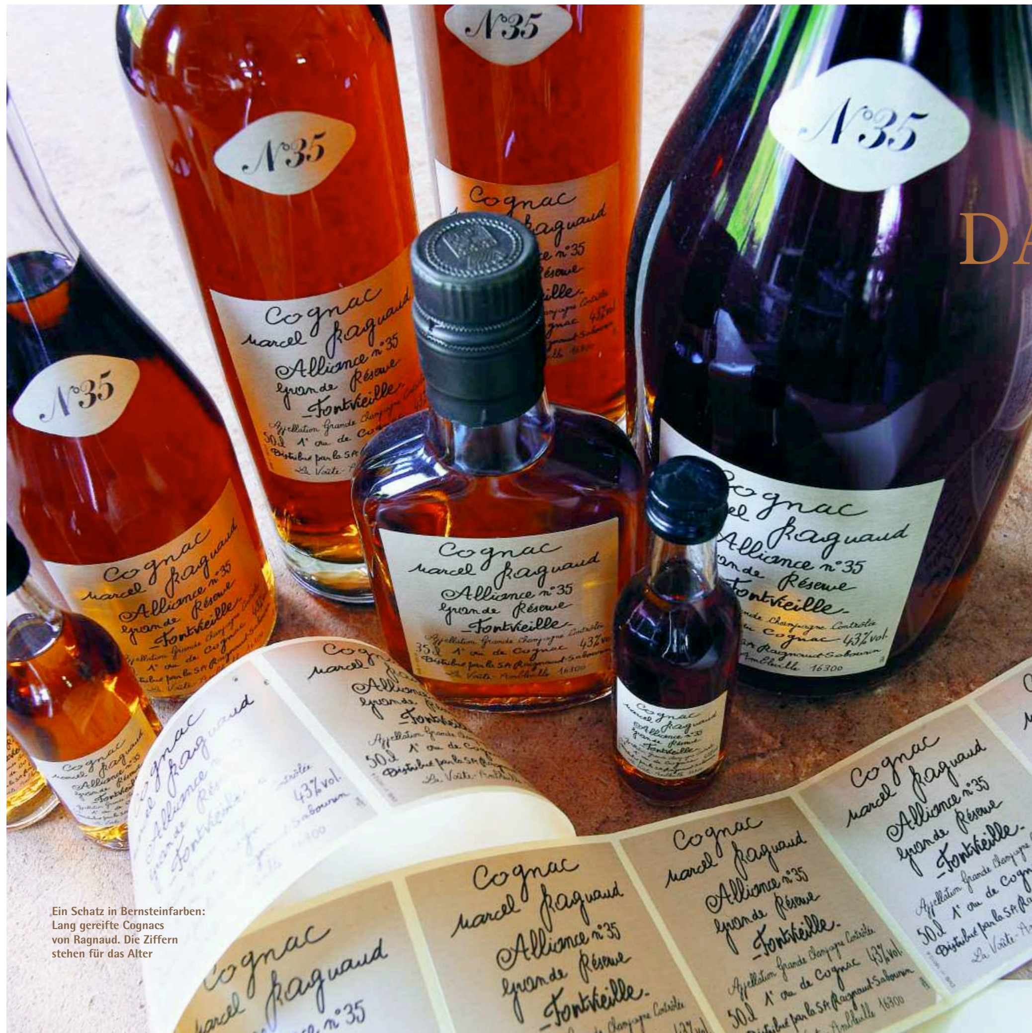
Ein Schatz in Bernsteinfarben: Lang gereifte Cognacs von Ragnaud. Die Ziffern stehen für das Alter